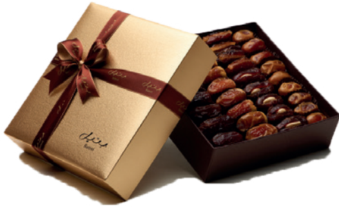
Luxeux coffret de dates