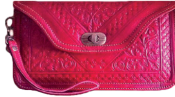
Portefeuilles en cuir