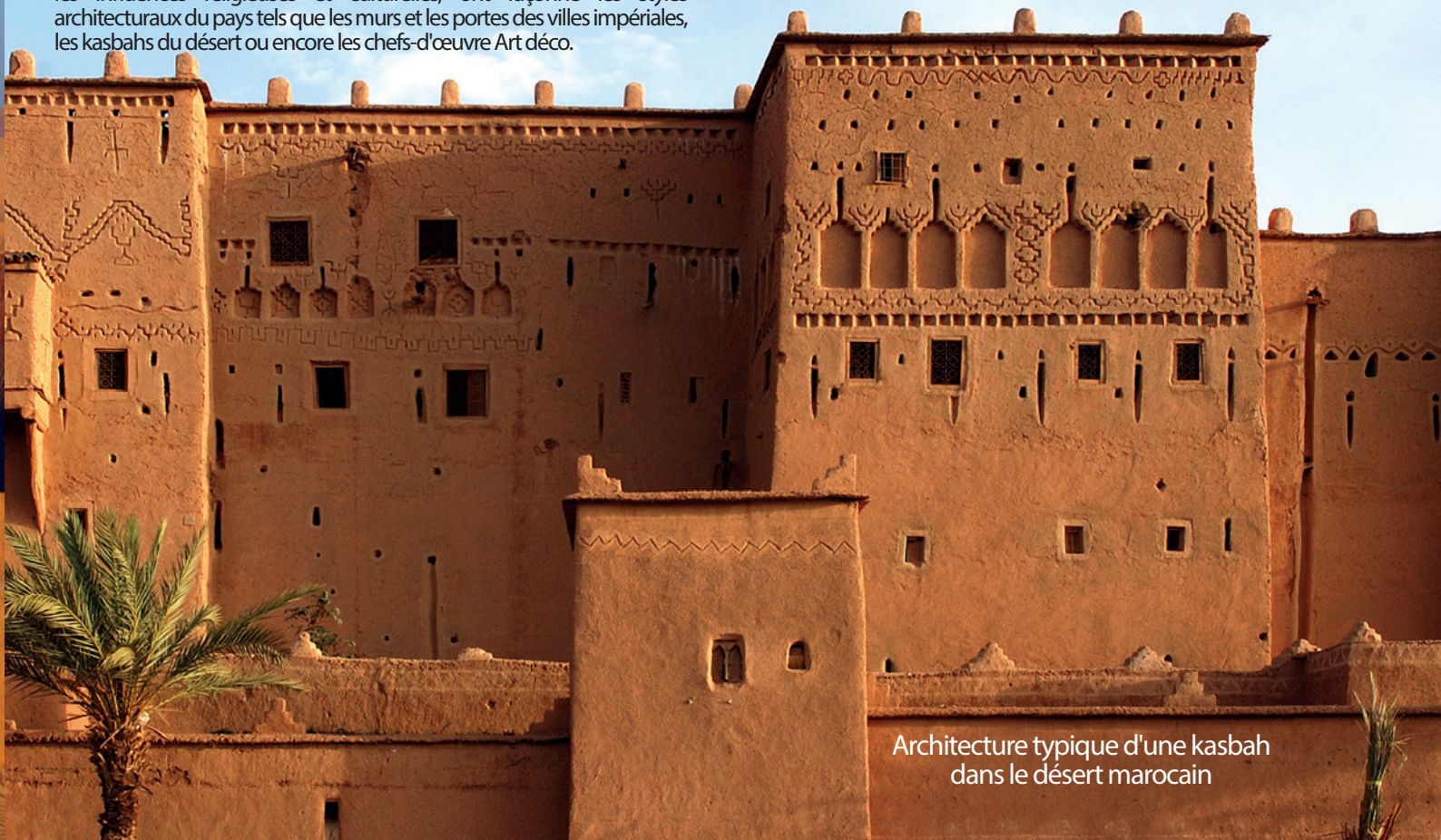
Architecture typique d'une kasbah dans le désert marocain

La longue histoire du peuple berbère, les envahisseurs étrangers ainsi que les influences religieuses et culturelles, ont façonné les styles architecturaux du pays tels que les murs et les portes des villes impériales, les kasbahs du désert ou encore les chefs-d'œuvre Art déco.